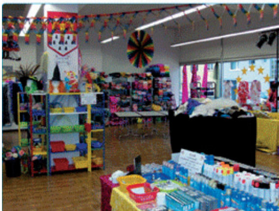
Das ELTERN- und FAMILIENMAGAZIN für den Rhein-Sieg-Kreis

Unsere Kunden erleben die JeckeBud zum shoppen und flanieren, für Beratung und Unterhaltung, für Kreativität und Vielfalt. Als besonderes „JeckeBud-Kamelchen“ finden Sie Rabattcoupons in unserer nebenstehenden Anzeige, mit denen das Einkaufen